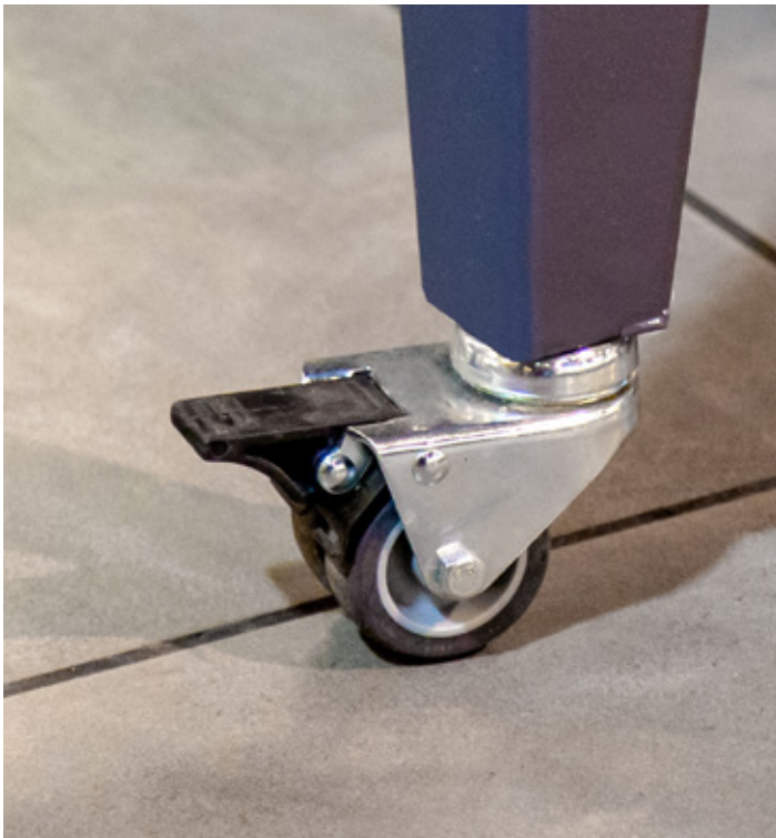
Надійні колеса з фіксаторами для мобільності вітрини Reliable wheels with locks for display mobility