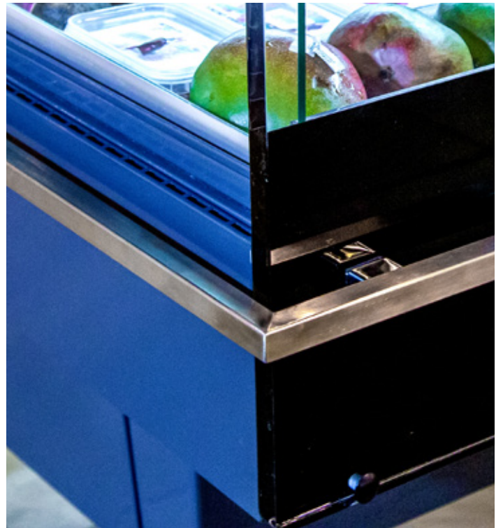
Бампер з нержавіючої сталі захищає від ударів візками (опція) The stainless steel bumper protects against trolley (option)