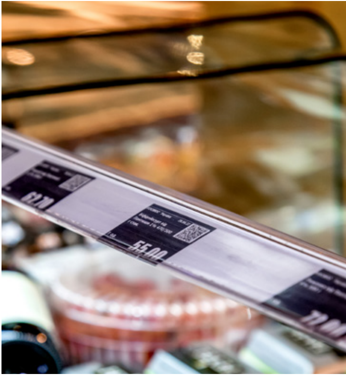
Ергономічні тримачі цінників Ergonomic price holders